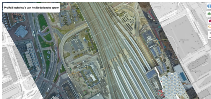
Figuur 1 – locatie van het project

Omdat de werkzaamheden dichtbij de sporen plaatsvind, is ProRail bij dit project betrokken. ProRail heeft APcon geselecteerd als partij voor het uitvoeren van de engineeringswerkzaamheden en de uitvoeringsbegeleiding van de uiteindelijke bouw activiteiten.