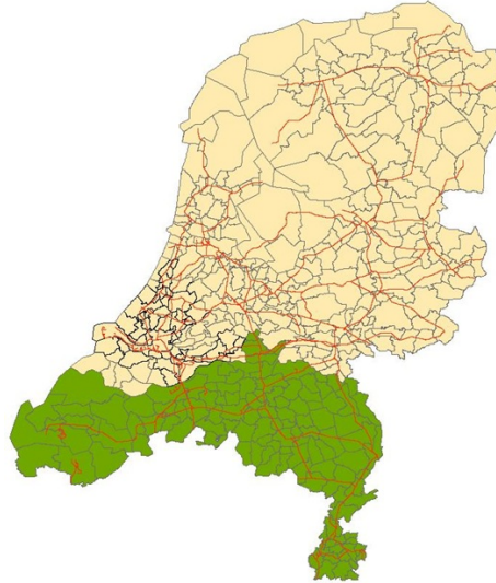
Figuur 1 – Weergave gebied regio Zuid

De door APcon uit te voeren inspecties hebben betrekking op kunstwerken gelegen binnen het beheersgebied van ProRail regio Zuid.